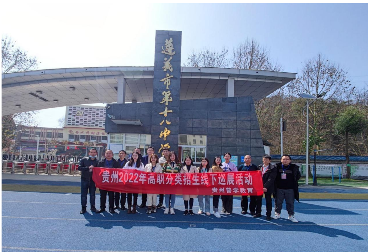
遵义市第十八中学