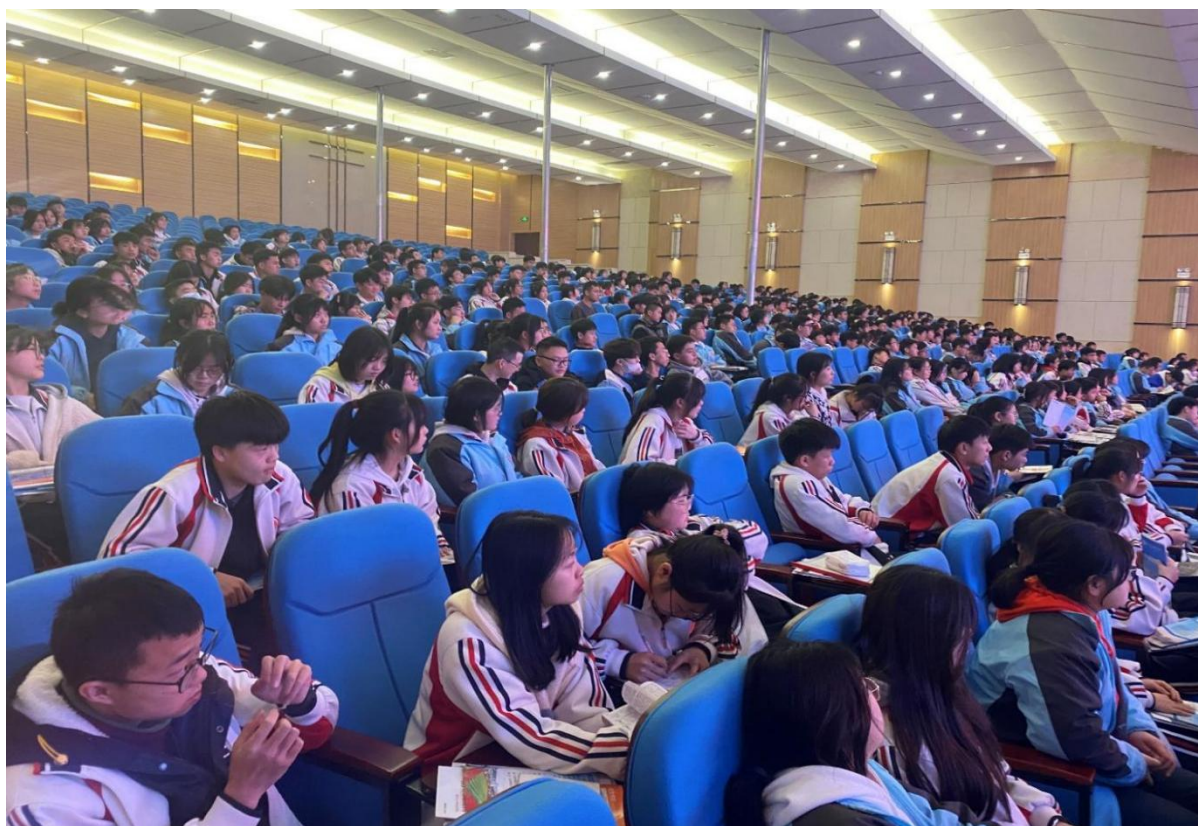
安顺市西秀区高级中学