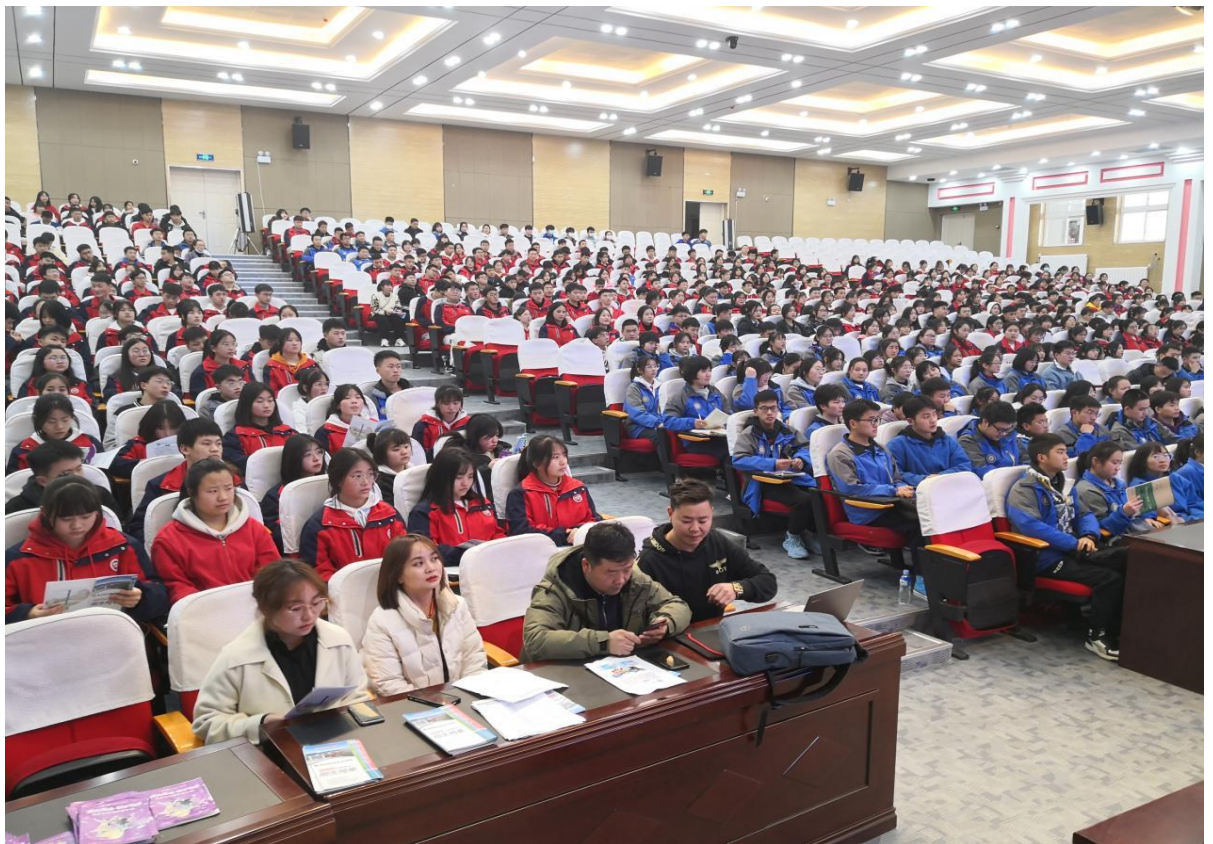
六盘水市第十中学