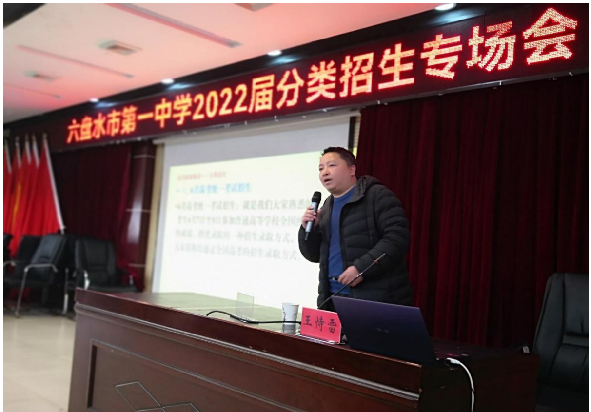
六盘水市第一中学（市招生考试管理中心领导致辞）