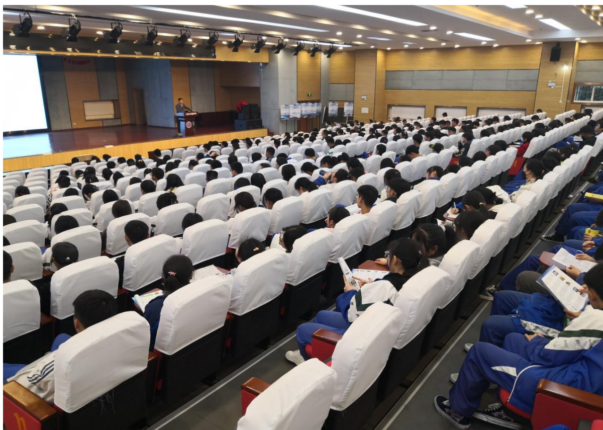
六盘水市第四中学